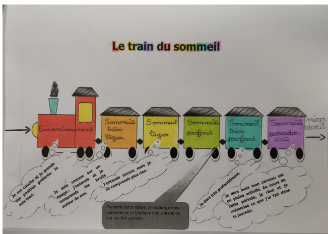
Le train du sommeil

Les ateliers Mémocerveau ont permis aux 5e de découvrir et de comprendre ce qui se passe pendant le sommeil et comment celui-ci est composé. Les enseignantes qui animent les ateliers ont choisi de présenter cette notion sous la forme d'un petit train, déjà rencontré par les CM2 l'année dernière.